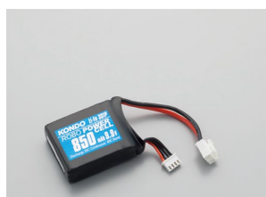
F3-850タイプ (Li-Fe) No.02171 ¥3,000