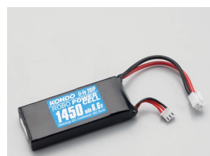
F2-1450タイプ (Li-Fe) No.02168 ¥3,200