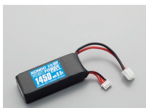
F3-1450タイプ (Li-Fe) No.02172 ¥3,500