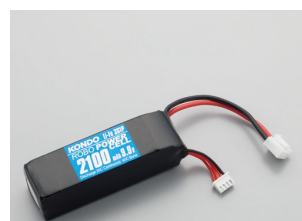
F3-2100タイプ (Li-Fe) No.02174 ¥4,500