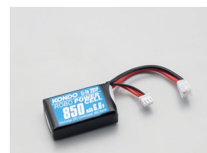
F2-850タイプ (Li-Fe) No.02167 ¥2,700